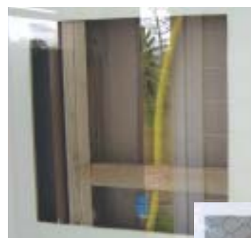
Detalhe das paredes

A área da cozinha e do banheiro é construída com parede hidráulica: placas RU (resistentes a umidade), estruturada por sarrafos de madeira tratada, possibilitando a passagem de toda hidráulica e elétrica por dentro dela.